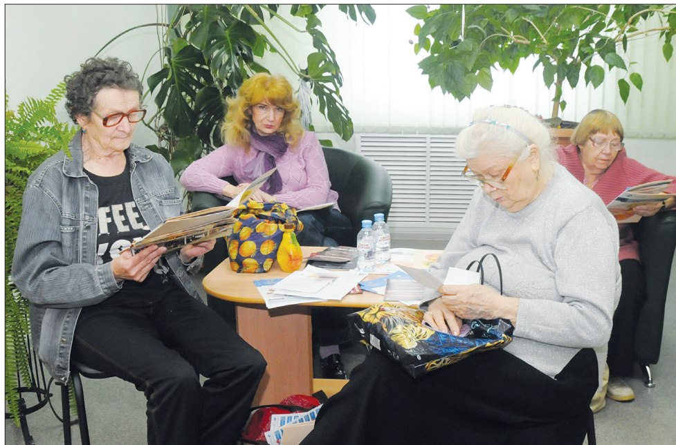
Пациенты ждут приема в зоне отдыха.